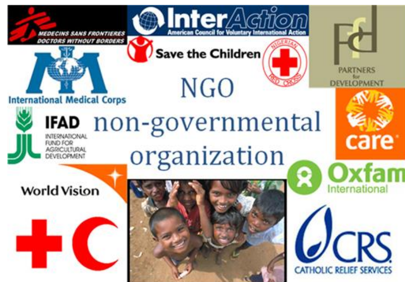
Tabla 17: Relación con ONGs