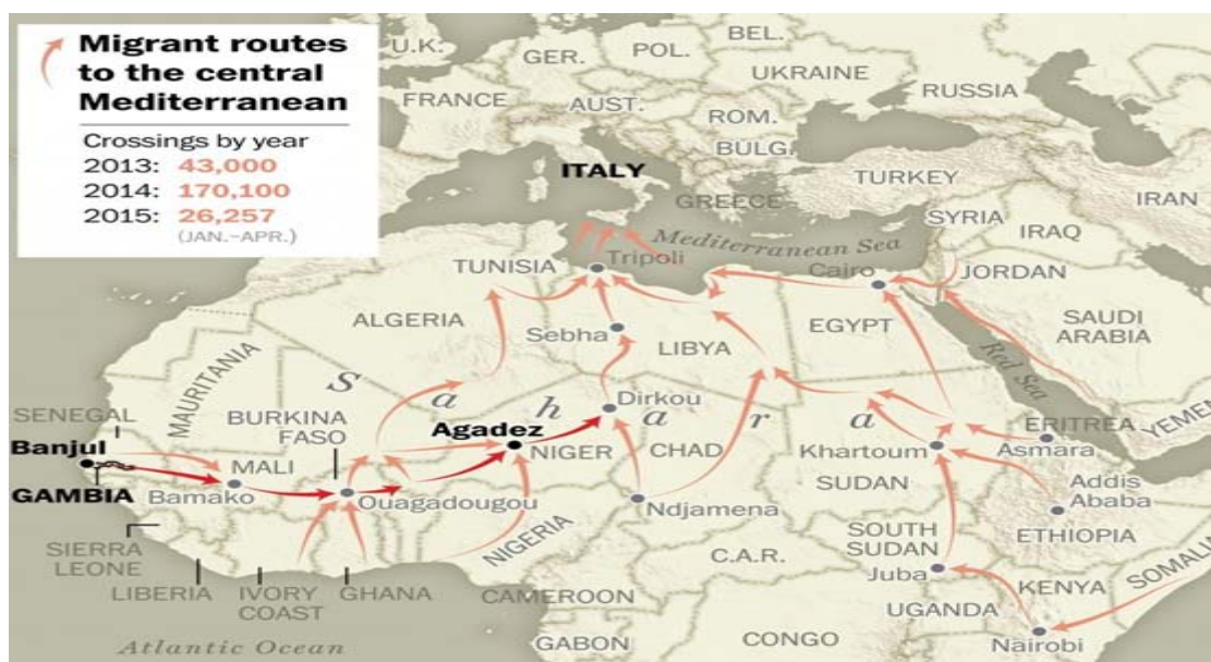
Figura 1. Rutas desde África Subsahariana hacia Europa

Ante el descontrol de la inmigración, la peligrosa inestabilidad de Libia 38 y los ataques terroristas que amenazan la seguridad dentro de los confines europeos, la Comisión Europea presentó una Agenda Europea de Migración 2014-2020 39 para gestionar esta crisis que sigue cruzando el Mediterráneo. 40