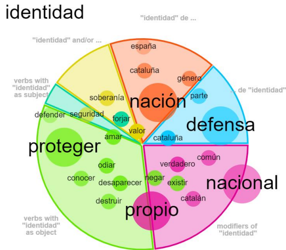
Ilustración 7. Concordancia de identidad

remiten al nativismo y el verbo proteger , vinculado con uno de los principales mandatos de la masculinidad patriarcal: la protección.