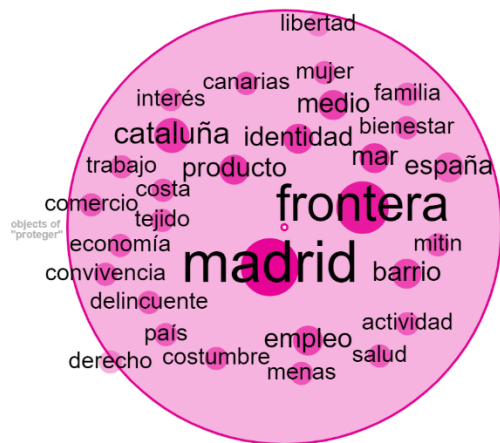
Ilustración 8. Concordancia de proteger

La masculinidad representada por Vox en Twitter muestra a un hombre protector de los entes e instituciones tradicionales como la familia patriarcal a través de la apropiación del lenguaje bélico que fue desplegado con más fuerza durante la crisis de la Covid-19. Las familias de españoles, dotadas de importancia en sus discursos y reivindicadas como núcleo central, son objeto de protección ante las élites, tal y como se observa en este tuit: