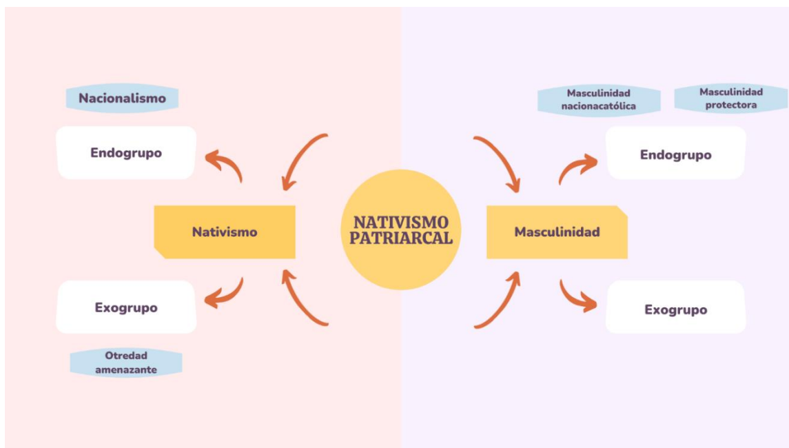
Ilustración 2. Esquema de los ejes del nativismo patriarcal. De elaboración propia.

El nacionalismo de Vox se apoya en símbolos, mitos y pasajes históricos que son narrados desde el patriotismo (cfr. Ballester, 2021). Para construir la comunidad nacional (re)produce un endogrupo etnonacionalista y un exogrupo amenazante. En esta activación del nativismo juega un papel central la masculinidad patriarcal puesto que la representación de unos determinados modelos masculinos activa el sentimiento nacionalista y el derecho agraviado frente a la alteridad. Esta investigación se centra en la masculinidad nacionalcatólica y la protectora por la mayor presencia discursiva de términos relativos a una determinada moral vinculada al catolicismo, al tradicionalismo, al familismo y a la protección que, al mismo tiempo, son pilares con los que se construye la estructura nativista patriarcal característica del partido. Un elemento fundamental en la construcción de las representaciones de las masculinidades son las prácticas lingüísticas, cobrando especial relevancia cuando hablamos de discursos políticos. En tanto que las prácticas indexan el género, se ve necesario una reflexión sobre las estrategias discursivas que emplea Vox y que remiten al hacer masculinidad.