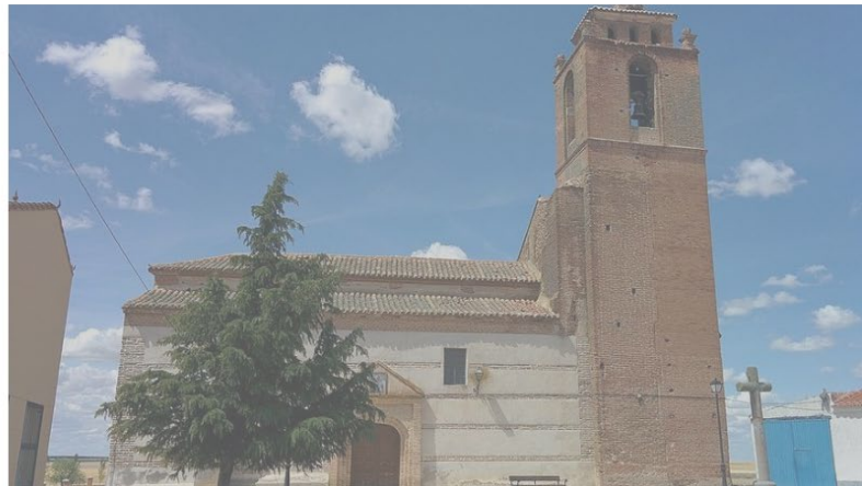
Blasconuño de Matababras, uno de los setenta pueblos en los que ha ganado Vox