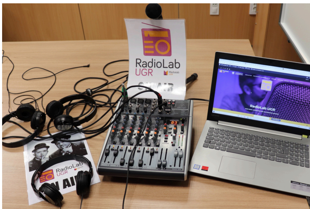
Figura 2. Fotografía del primer equipo técnico de Radiolab UGR. Año 2017-2018