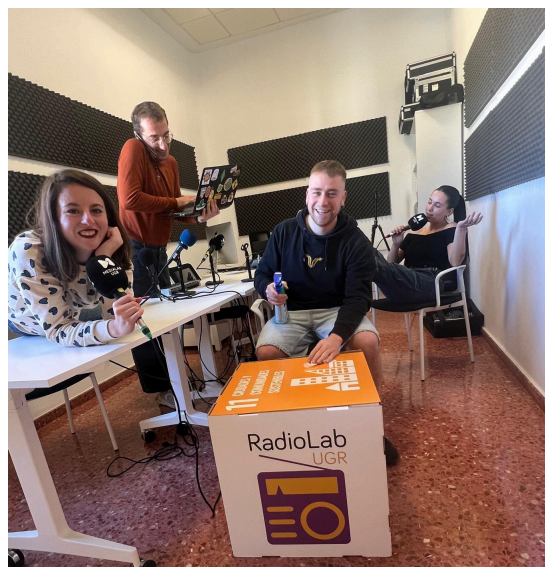
Figuras 5. Imágenes de Radiolab UGR de 2024. A la izquierda una entrevista al expresidente José Luis Rodríguez Zapatero. A la derecha el equipo de radiolab en el estudio actual.