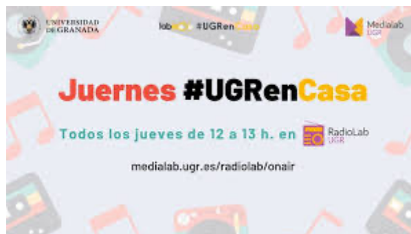
Figura 1. Cartel de uno de los programas en Radiolab UGR durante la COVID-19

Durante la pandemia de COVID-19, la radio digital desempeñó un papel crucial en la educación remota de emergencia, ayudando a superar la brecha digital y facilitando un proceso de aprendizaje interactivo en diferentes universidades de todo el mundo.(Yersel et al., 2023). En ese sentido, Radiolab UGR, jugó un papel fundamental durante la pandemia, incorporando también la retransmisión en YouTube, ver figura 1.