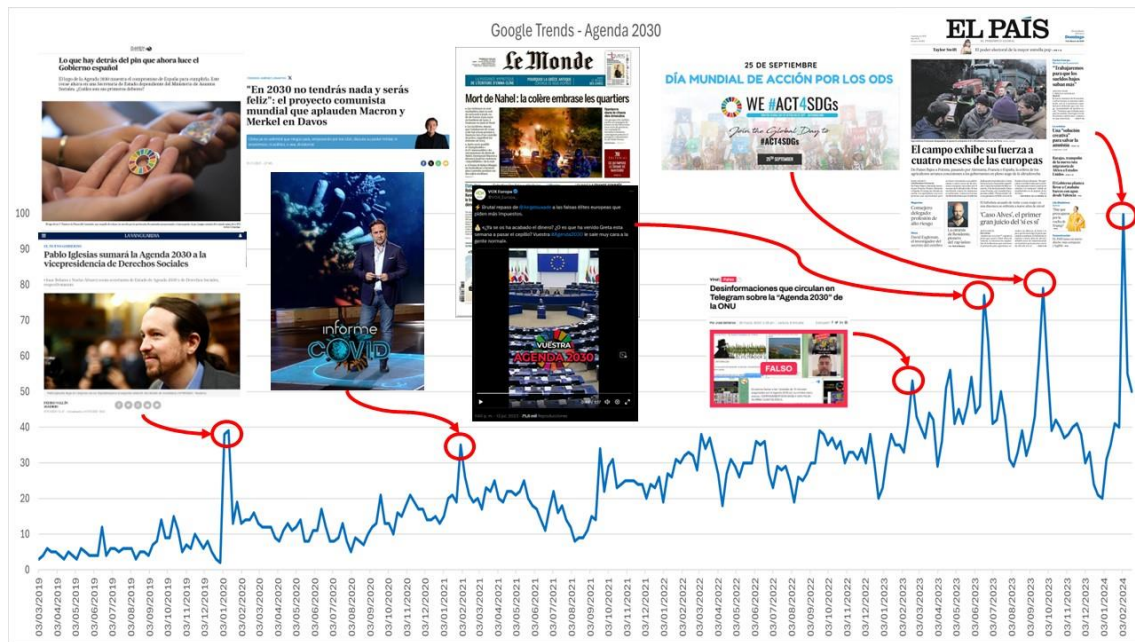
Figura 2: Últimos cinco años de interés de búsqueda del término “Agenda 2030” en Google, datos de Google Trends, junto a los principales hitos mediáticos detectados (elaboración propia)

digitales y sociales, hemos podido trazar una suerte de “línea del tiempo” de la semantización de este concepto (y las controversias asociadas al mismo) en el ecosistema mediático digital en español: